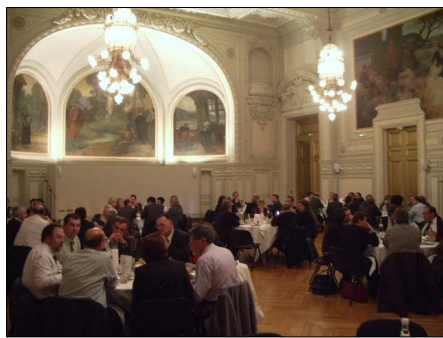
ACCUEIL DANS LES SALONS DE LA MAIRIE DE TOURS