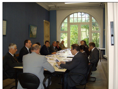
LE PLAN D'ACTION SANTE POUR LES APPRENTIS EN PRESENCE DE LA REGION ET GRPS