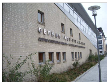
VISITE DES INSTALLATIONS DU CEFRAL A DUNKERQUE