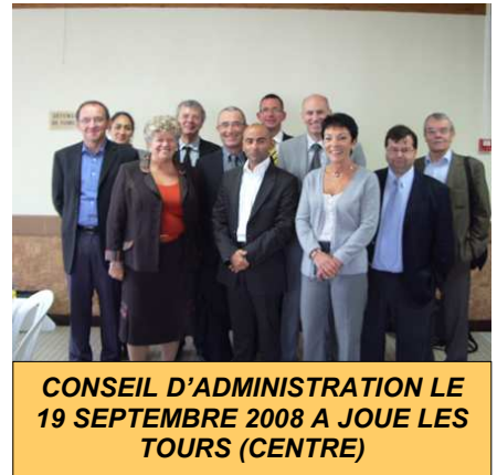
CONSEIL D'ADMINISTRATION LE 19 SEPTEMBRE 2008 A JOUE LES TOURS (CENTRE)

NOMBRE DE CA EN 2009: 5 dont 2 à Joué les Tours